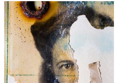
© Nick Mangafas, Wira Chroniowska Stryj, Ukraine