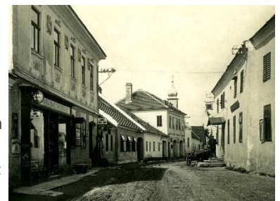
© Ansichtskarte um 1935, Privatsammlung Polleroß